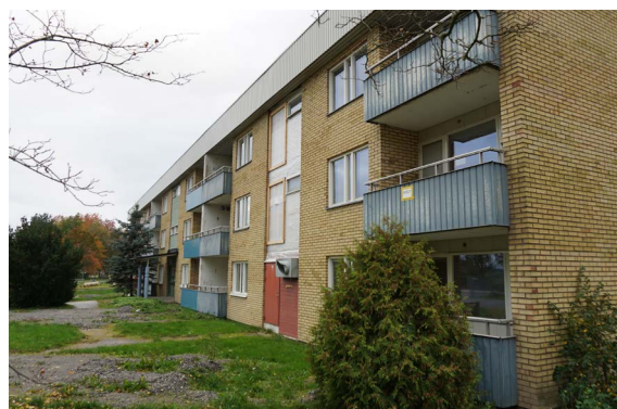
Kvarteret Hjälmén 2 före