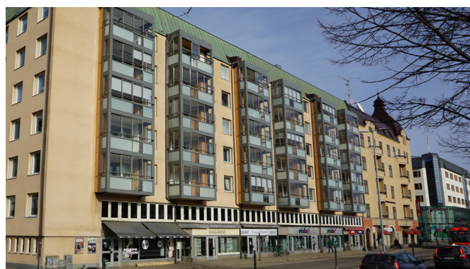
HSB Brf Jägaren - efter