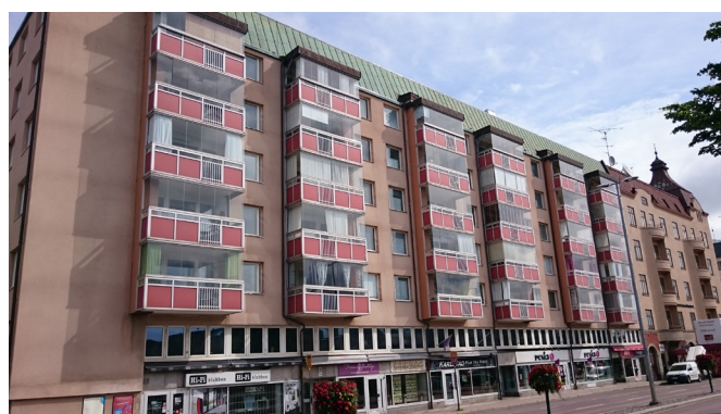
HSB Brf Jägaren - före

Med Balcos unika Twin-lucka får du två system i ett. Maximal flexibilitet och möjlighet att öppna upp hela balkongen. Den smarta glasluckan går nämligen både att öppna som en helt vanlig skjutlucka och att vika in som en vikglaslucka.